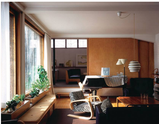
圖 | Aalto House 內部空間 | https://reurl.cc/yOyXxM